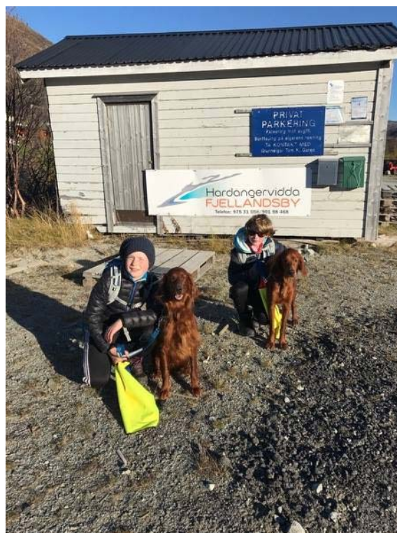
De to yngste førerne som var meget fornøyd med utfordringen