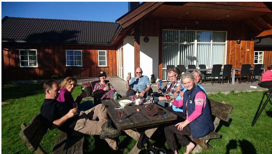
Ettermiddagskos i nydelig vær og på en nydelig hytte !