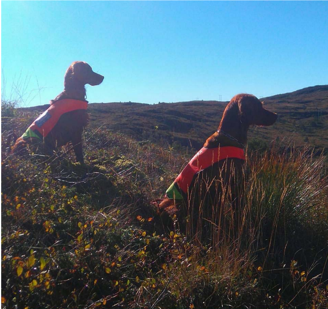
Guinness og Nala som oppnådde 1. AK på Egersund prøven samme dag