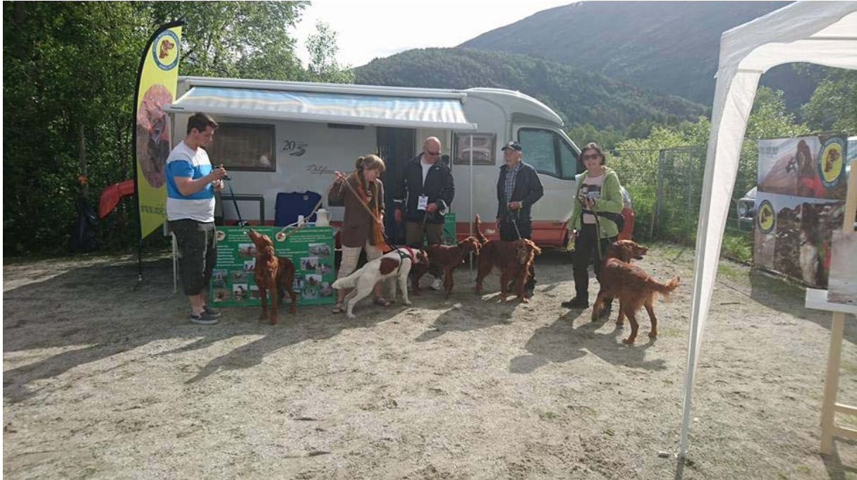
NISK klubb stand med ulike representanter ☺