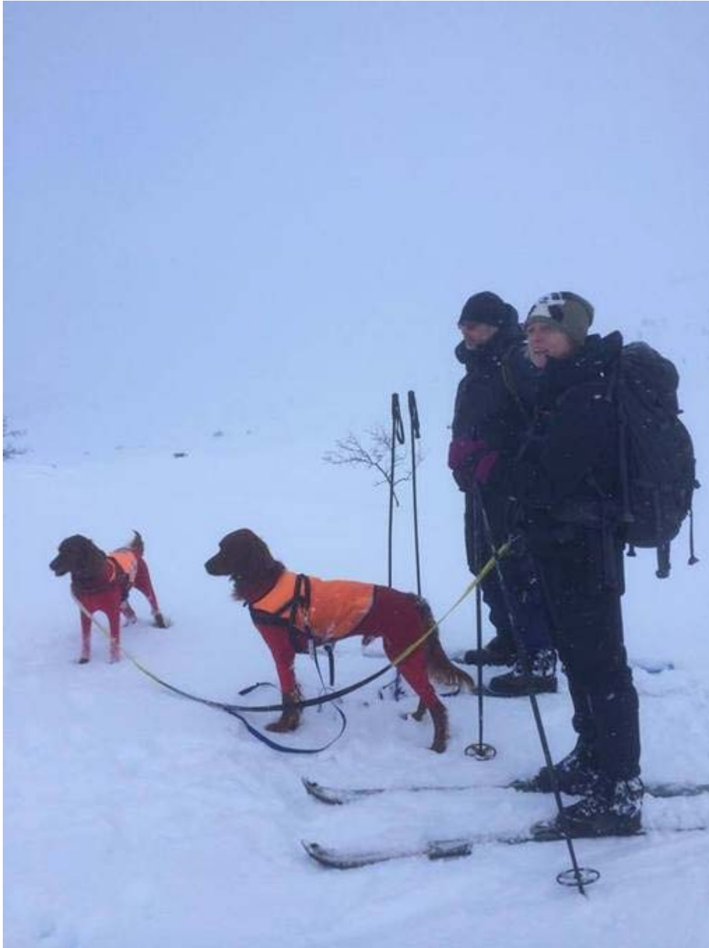
Fra et av lørdagspartiene