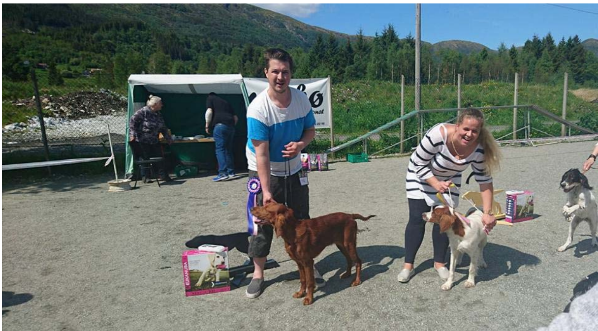
Best i Rasen valper; Cayuse og Fia