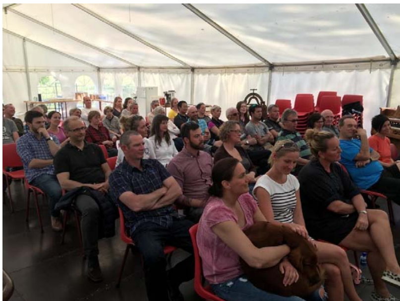
Hele 46 fuglehundvenner kom ☺